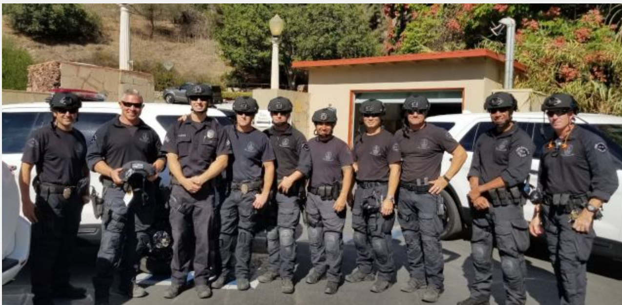
En la foto, unidad canina de la LAPD con cascos Team Wendy.

Las Policías –Local y Provincial digamos– de Los Angeles (EE.UU.) equipan a sus 180 miembros de sus equipos tácticos con cascos Team Wendy. SoldierSystems.